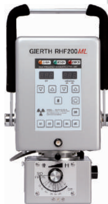
GIERTH RHF 200 ML Das universelle Resonanz- Hochfrequenz-Röntgen- gerät für den Tierarzt!