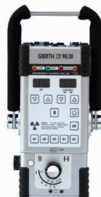
GIERTH TR 90/30 Das Leistungsstärkste im Kleinformat