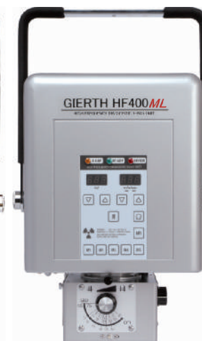
GIERTH HF 400 ML Das Kraftpaket unter den portablen HF-Röntgengeräten

Distribution Schweiz: Fujifilm (Switzerland) AG - Niederhaslistrasse 12 - 8157 Dielsdorf Tel. +41 44 855 50 50 medical@fujifilm.ch | www.fujifilm-medical.ch