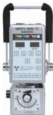
GIERTH HF 80/20 ULTRA LIGHT Hochfrequenz- Röntgengerät