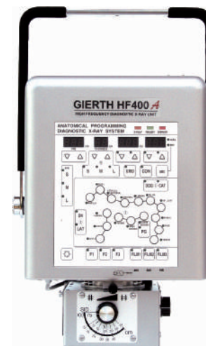
GIERTH HF 400 A Das Kraftpaket unter den portablen HF-Röntgengeräten mit Anatomie- programm