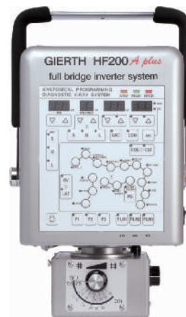
GIERTH HF 200 A plus Hochfrequenz-Röntgengerät mit Anatomieprogramm