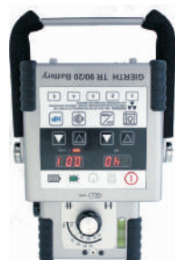
GIERTH TR 90/20 Battery Batteriebetriebenes Hochfrequenz- Röntgengerät